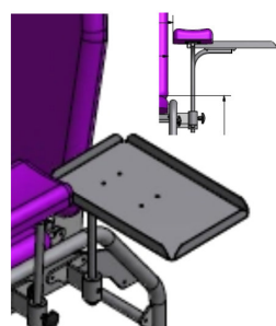
stalowy blat zabiegowy